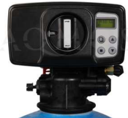
Abb. 2: Steuerventil BNT 1650

GFK- Druckflasche, gefüllt mit hochwertigem Ionenaustauscherharz, modernes Design, Kabinettgehäuse für einen Salzvorrat von max. 25kg, aufschiebbarer Deckel, mengengesteuertes Zentralsteuerventil Typ BNT 1650, integriertes Feinverschneidungsventil, Absaugeinrichtung und Verbindungsleitung zum Zentralsteuerventil, Abwasserschlauch 12 Ømm – Länge 2.000 mm.