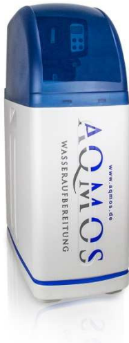
Abb. 1: Aqmos BM-R2D2-32