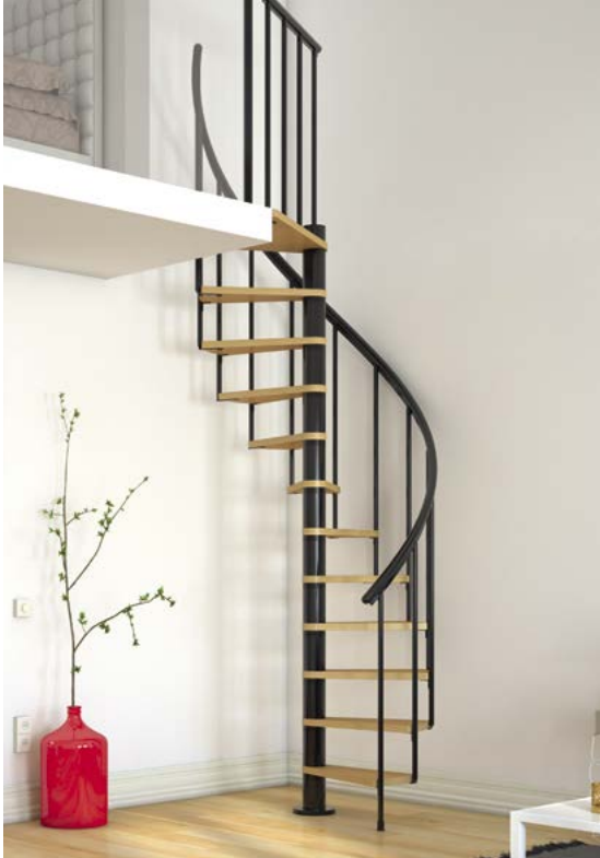
Escalier secondaire avec structure métallique et marches en bois