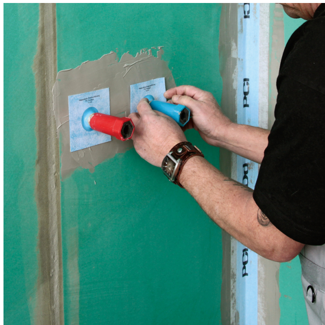
2. Procéder à l'étanchéité des passages de tuyaux par la mise en place des manchettes PCI Pecitape 10 x 10 marouflées dans le PCI Lastogum.