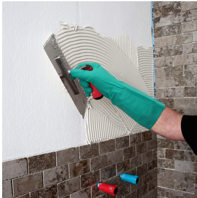
6. Après séchage, poser le carrelage.