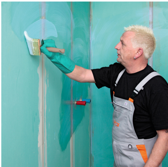
1. Primaire : sur supports minéraux absorbants ou plâtre et plaques de plâtre cartonnées, appliquer une couche de primaire PCI Gisogrund.