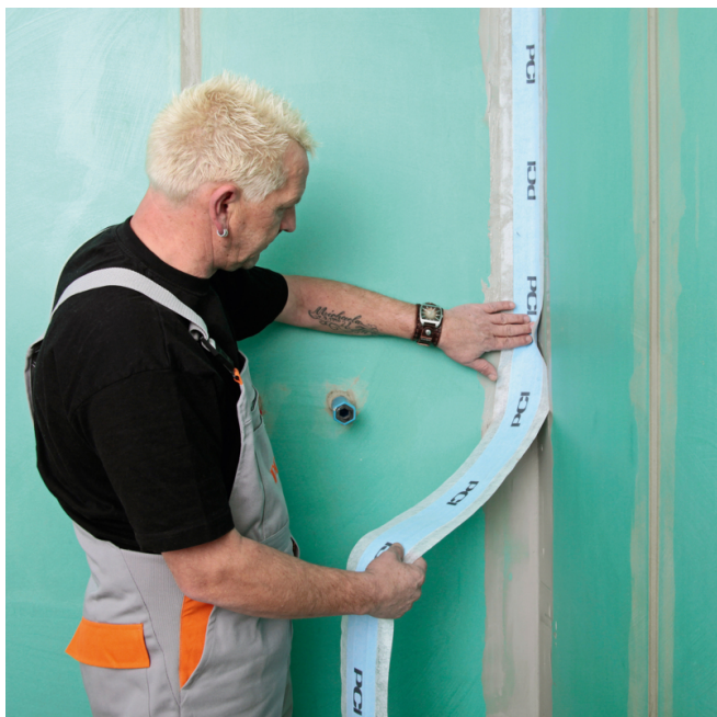
3. Coller la bande PCI Pecitape 120 (ou Pecitape Objekt 120 mm) dans les angles et liaisons sol/mur. La bande autocollante PCI Pecitape WS peut également être utilisée.