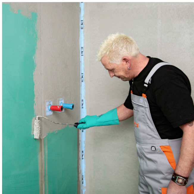
4. Appliquer la première couche de PCI Lastogum de façon uniforme et continue sur le support.