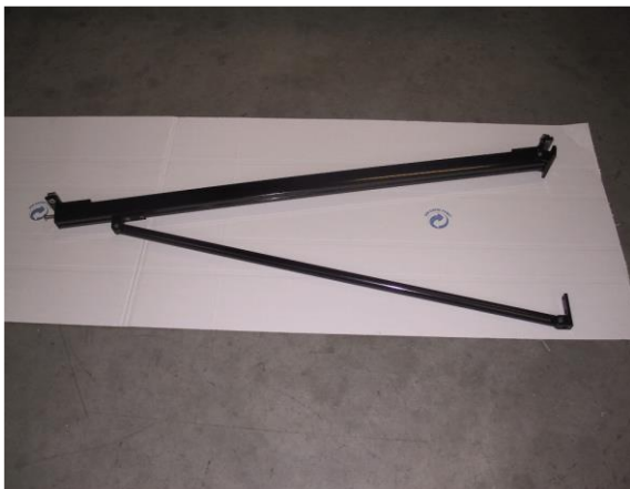
Abbildung 2 (Stützarm vormontiert)

Schrauben Sie nun mit einem kleinen Kreuzschlitzschraubendreher die Endkappen von den C-Profilen (Siehe Abbildung 1)