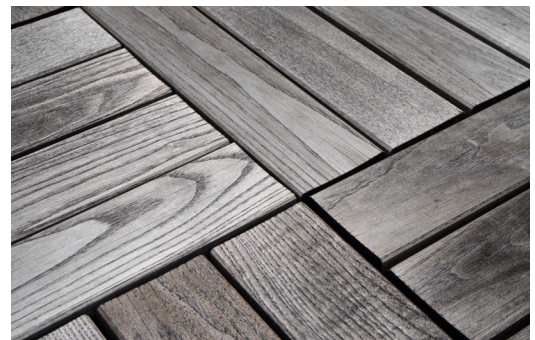
Natürlicher Farbton nach einigen Monaten ohne Behandlung