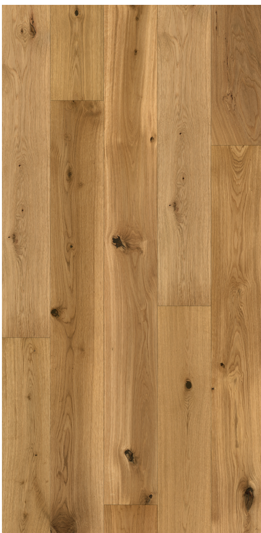
Exemple de surface

Lorsque l'on décide d'acheter un nouveau parquet, il ne suffit pas de choisir la couleur et l'essence du bois. En effet, la classe du revêtement de sol est également un point décisif pour l'effet global dans votre maison. Les classes des parquets vous servent de catégorisation, qui décrit l'aspect du revêtement de sol.