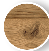
Nœuds non traversants