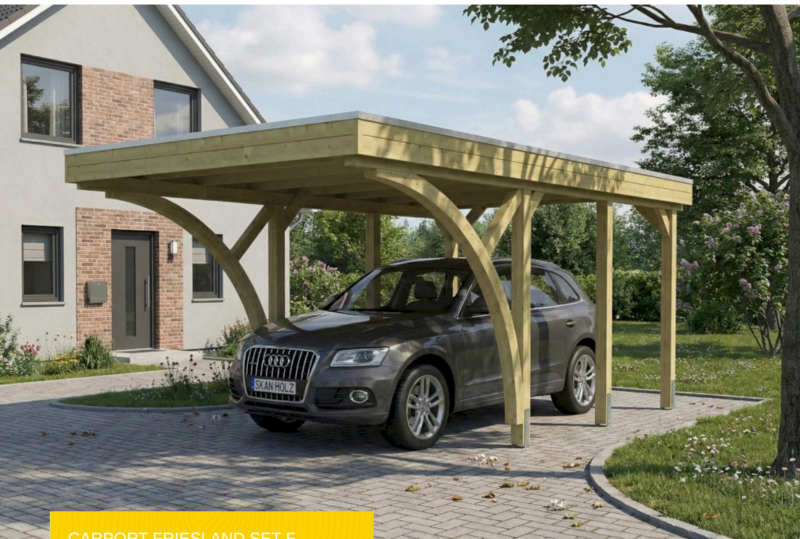
CARPORT FRIESLAND SET F 320 x 555 cm