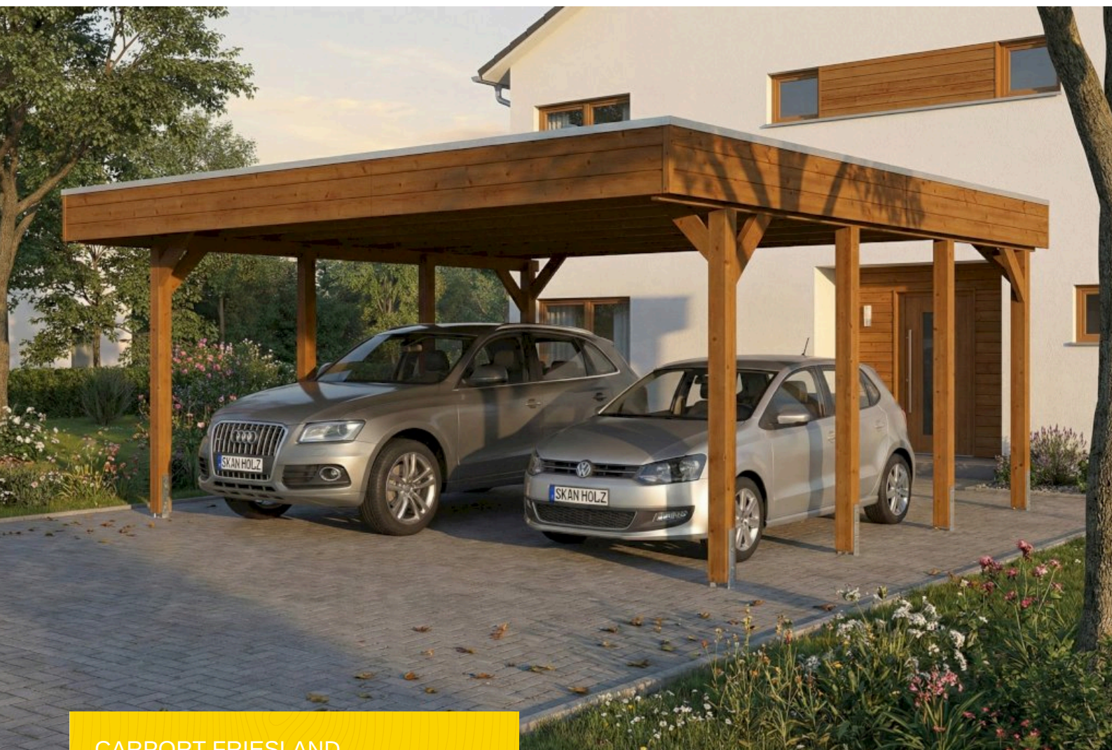
CARPORT FRIESLAND 546 x 555 cm