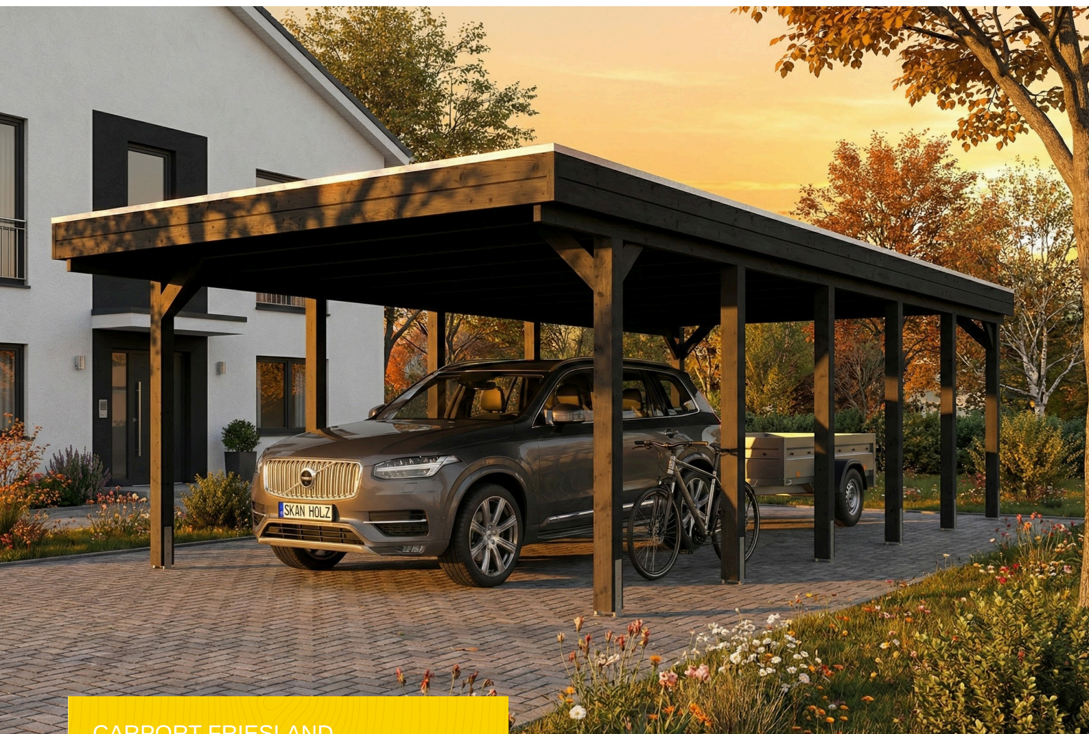
CARPORT FRIESLAND 402 x 860 cm