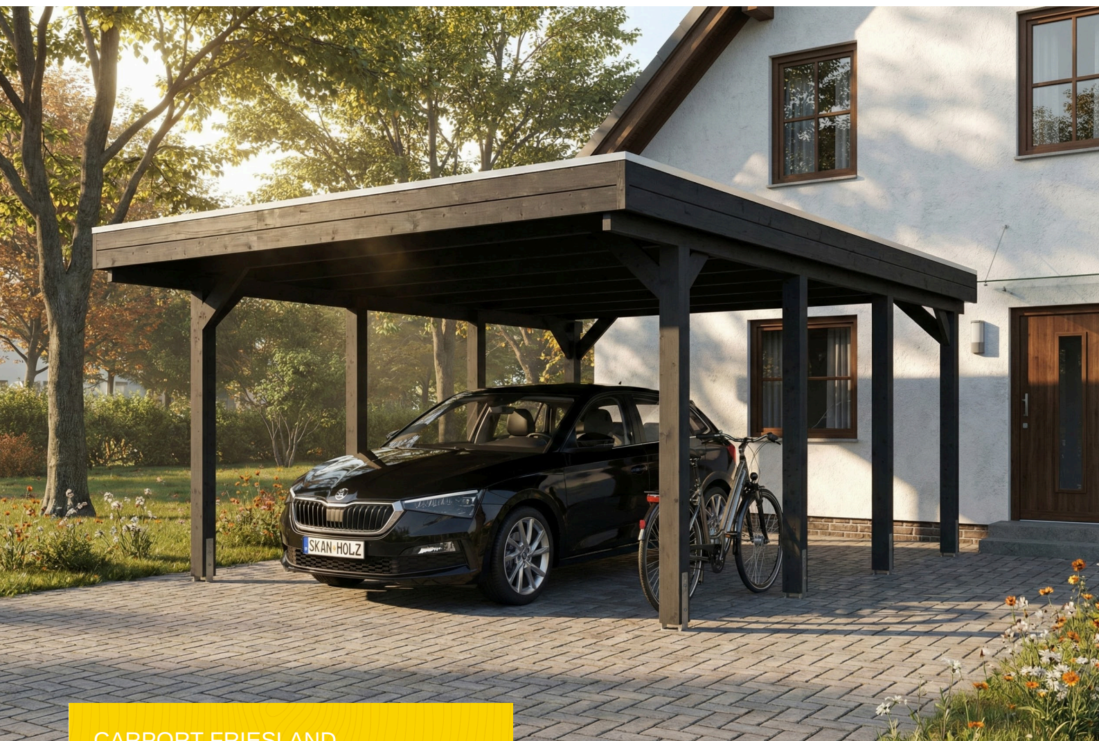
CARPORT FRIESLAND 402 x 555 cm