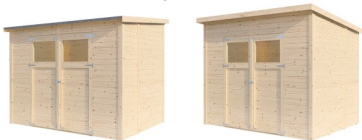
Flex Roof System