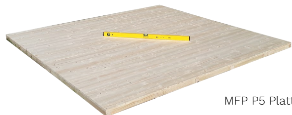
MFP P5 Platten

Fußbodenelemente* von unten behandeln, zusammenlegen, umdrehen und mit einer Wasserwaage ausrichten.