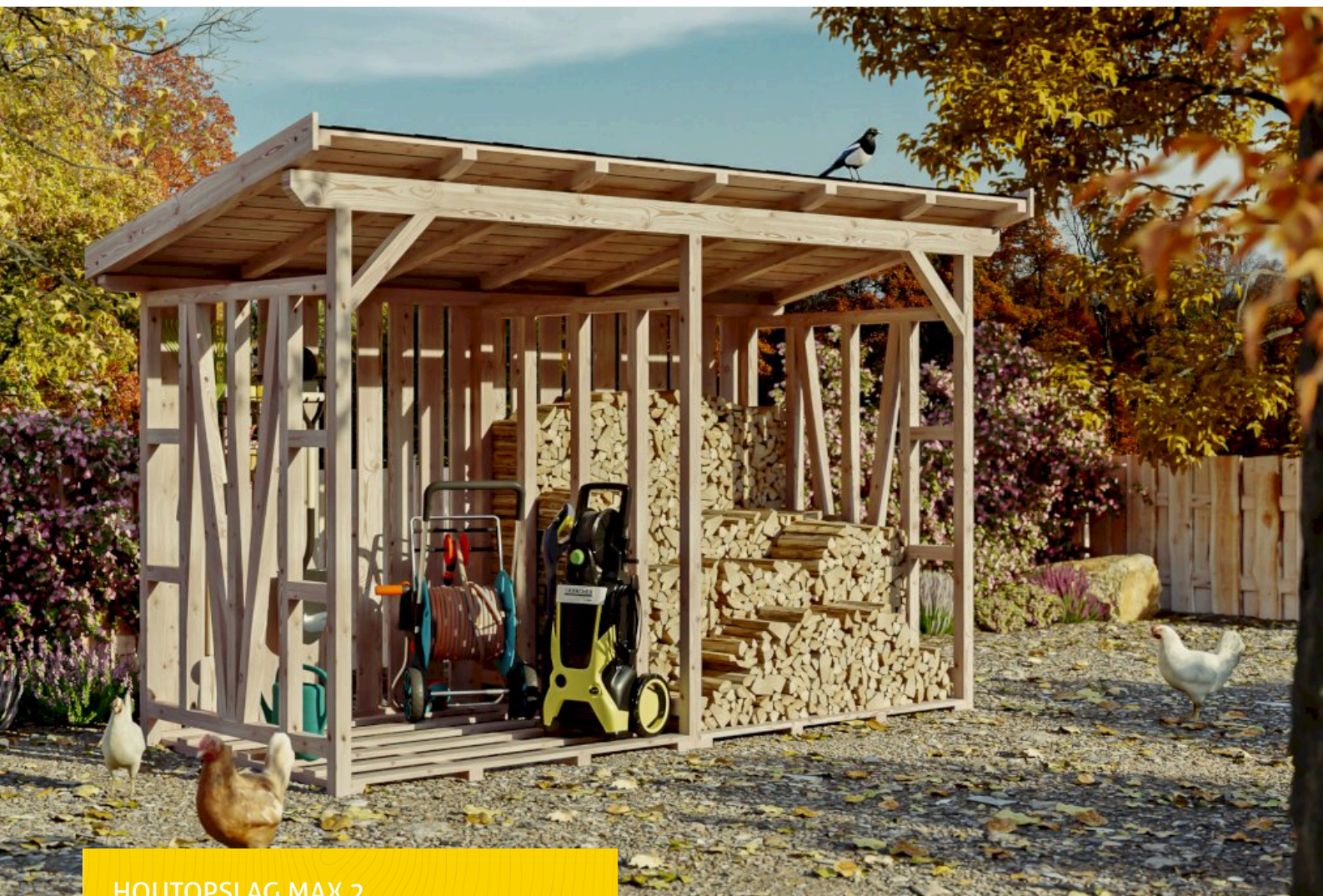
HOUTOPSLAG MAX 2 370 x 160 cm