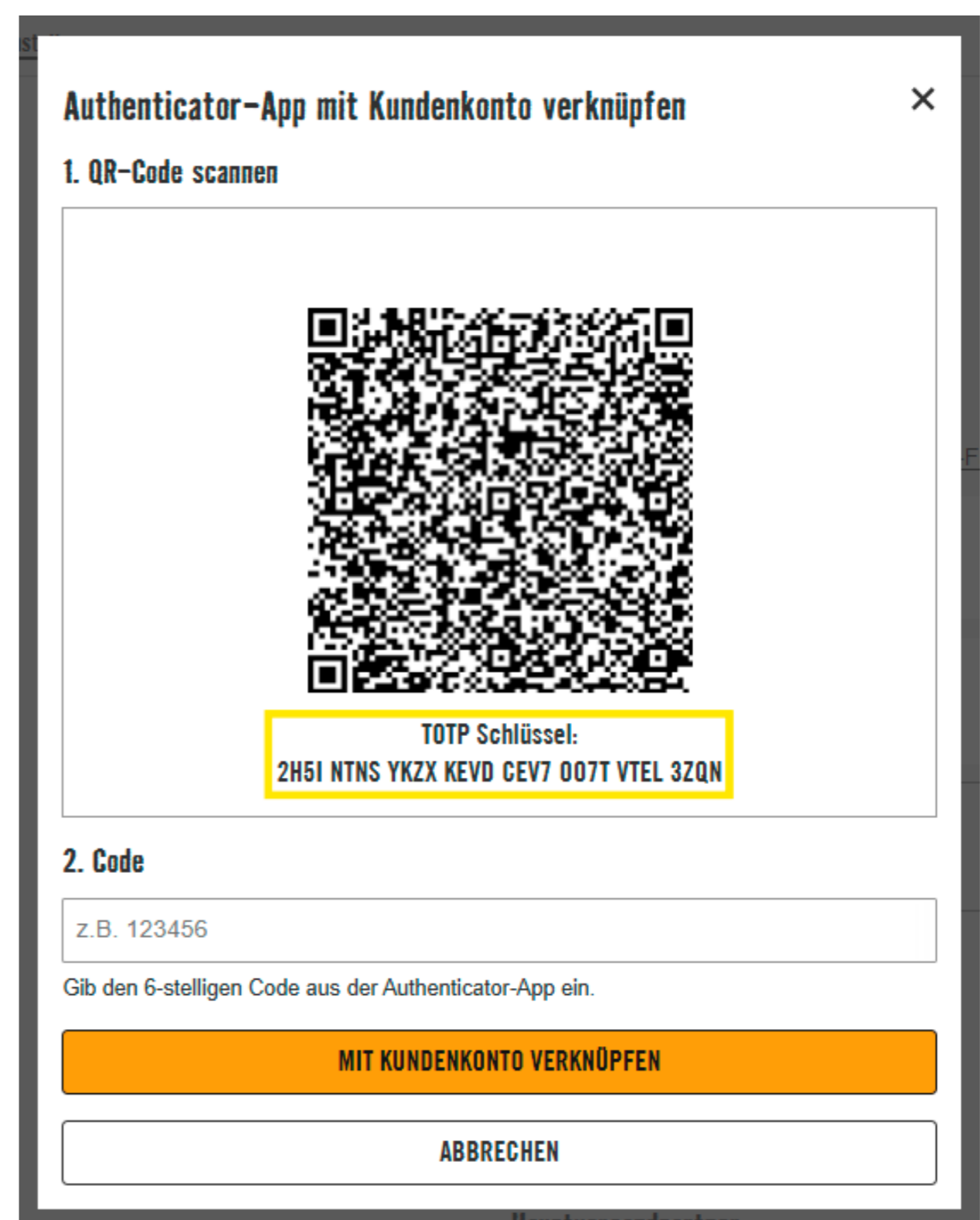
(2) Neues Fenster mit QR-Code